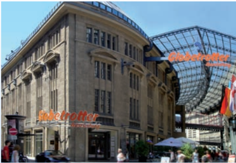
Globetrotter Ausrüstung im Olivandenhof