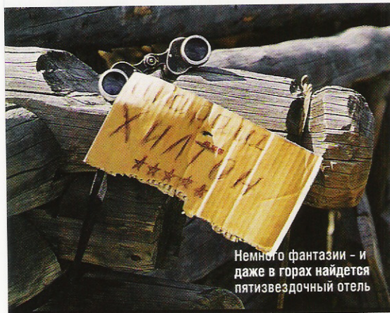
Немного фантазии – и даже в горах найдется пятизвездочный отель

По разработанному еще в Москве плану разложили вытяги с запахом барса (их изготовили в зоопарке), на верху горы организовали засидку – замаскированную сеть яму для наблюдения. И начали ждать. Вокруг необъятные просторы Горного Алтая, сизый вечерний сумрак и склоны самой высокой сибирской горы Белухи на горизонте.