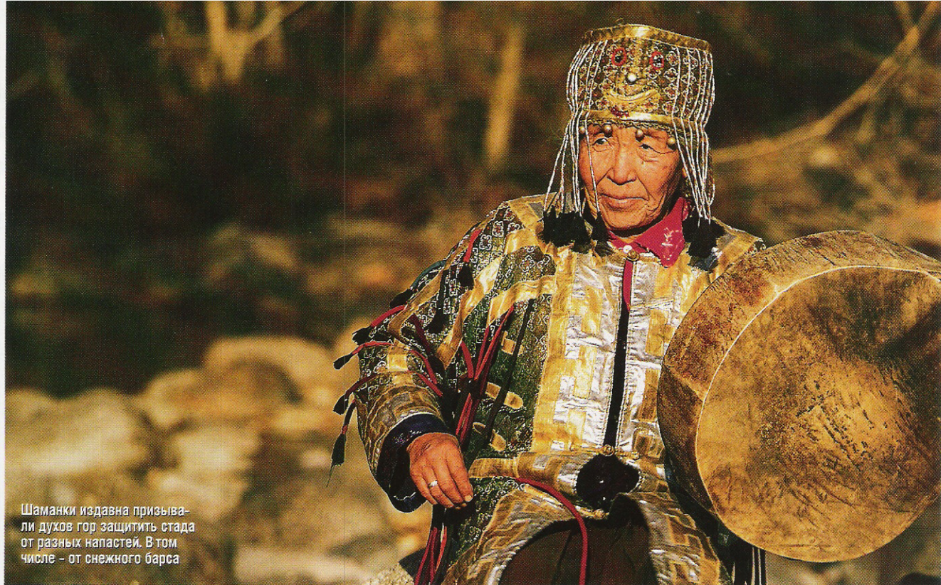
Шаманки издавна призывали духов гор защитить стада от разных напастей. В том числе – от снежного барса