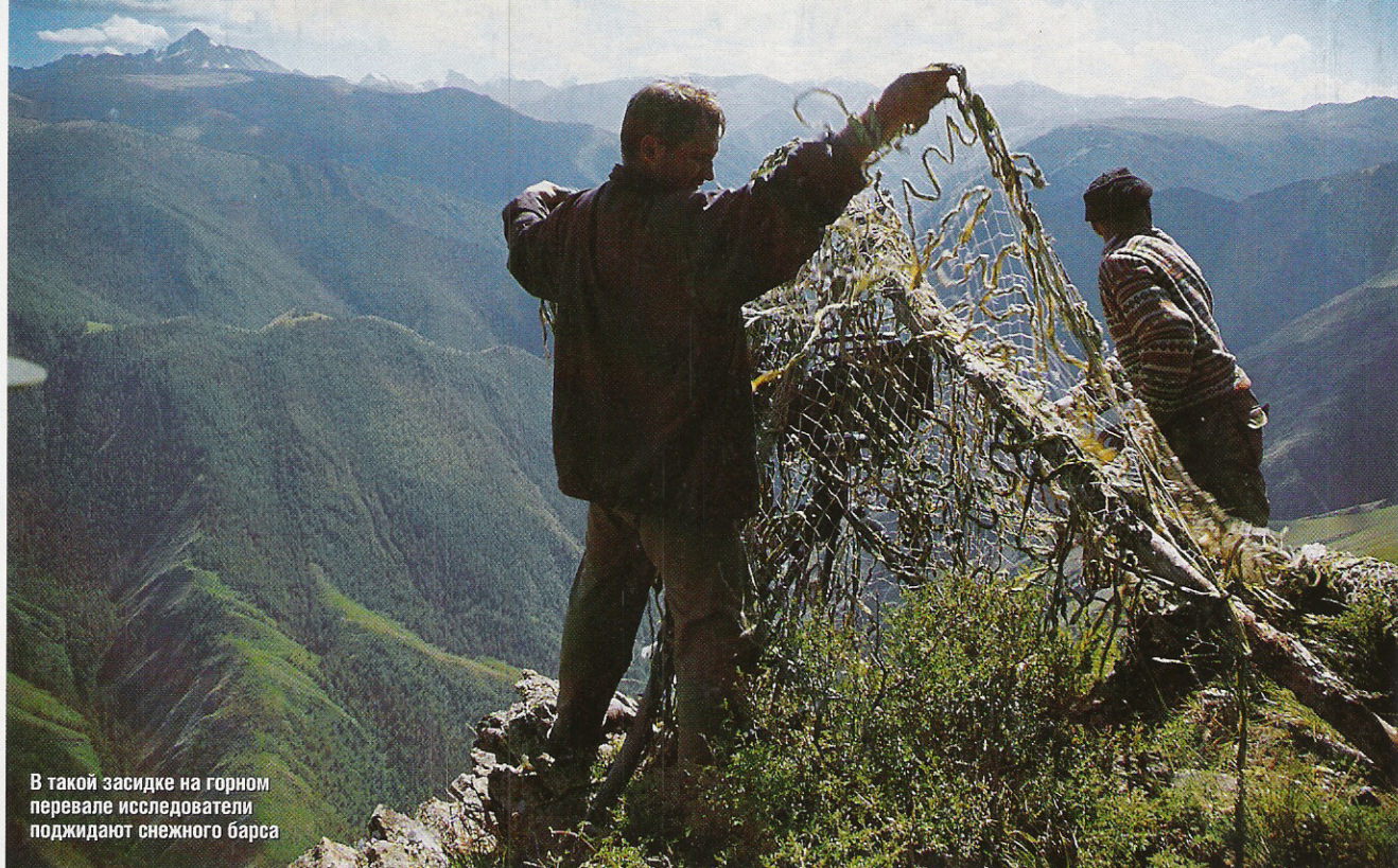
В такой засидке на горном перевале исследователи поджидают снежного барса