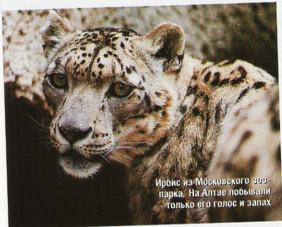
Ирбис из Московского зоопарка. На Алтае побывали только его голос и запах

Сейчас, в июле 2004 года, присоединившись к экспедиции международной программы «Человек и биосфера» при содействии Всемирного ►