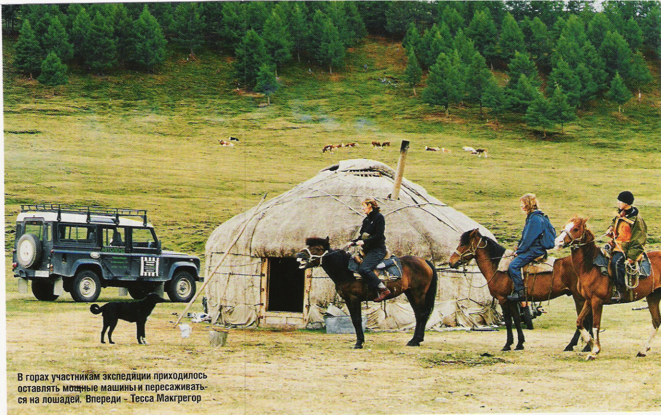
В горах участникам экспедиции приходилось оставлять мощные машины и пересаживаться на лошадей. Впереди – Тесса Макгрегор